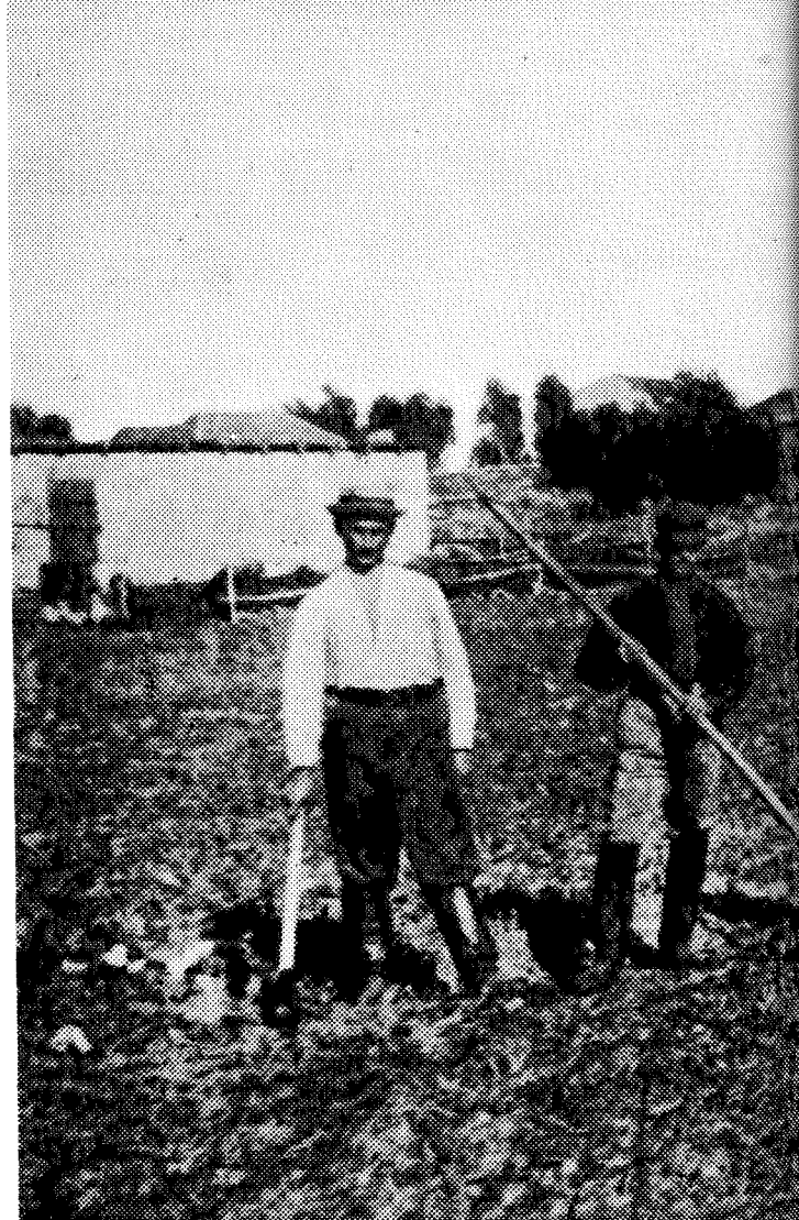
קבוצת איכרים בדחובות, סמוך לסוף המאה ה-19, התקופה בה נשלחו ה"מכתבים" של בן אדם ובן חוה

הכתבות גרמו סערה גדולה ביישוב. כל עסקני הפקידות חיכו בפחד מתי יבוא תורם ועשו מאמצים לגלות, מעטם של מי יצאו הכתבות. בשל העברית היפה והנמלצת של "בן אדם" חשדו שמדובר במורה החדש וילקומיץ, אך לא היו להם הוכחות כי ועד המושבה, שבו כיהן "בן חוה"